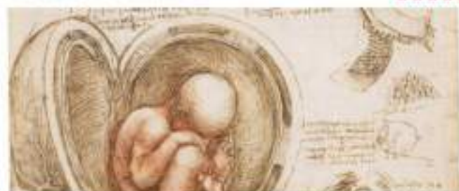
Royal Collection, en la obra 'Leonardo da Vinci. Una vida en dibujos'.