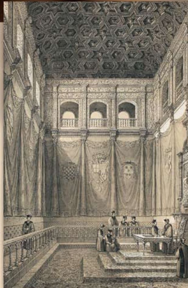
Paraninfo de la Universidad de Alcalá de Henares