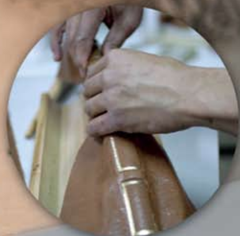
Encuadernación holandesa en piel de vacuno