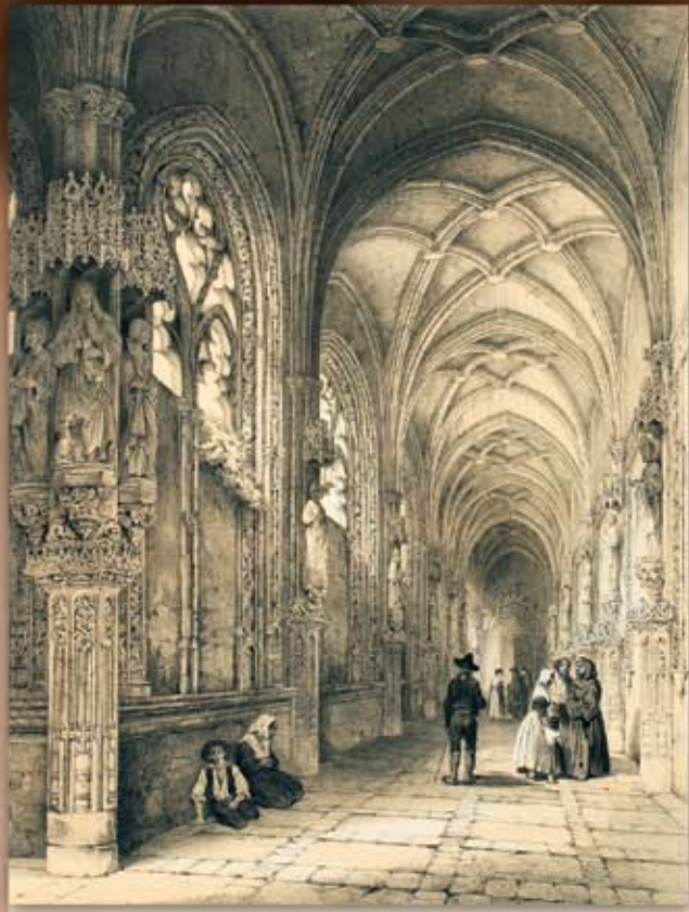
Claustro del Convento de San Juan de los Reyes, Toledo