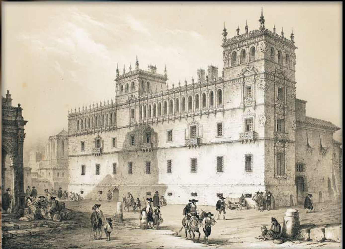
Palacio del Conde de Monterrey, Salamanca

La España Artística y Monumental es la obra cumbre del Romanticismo español.