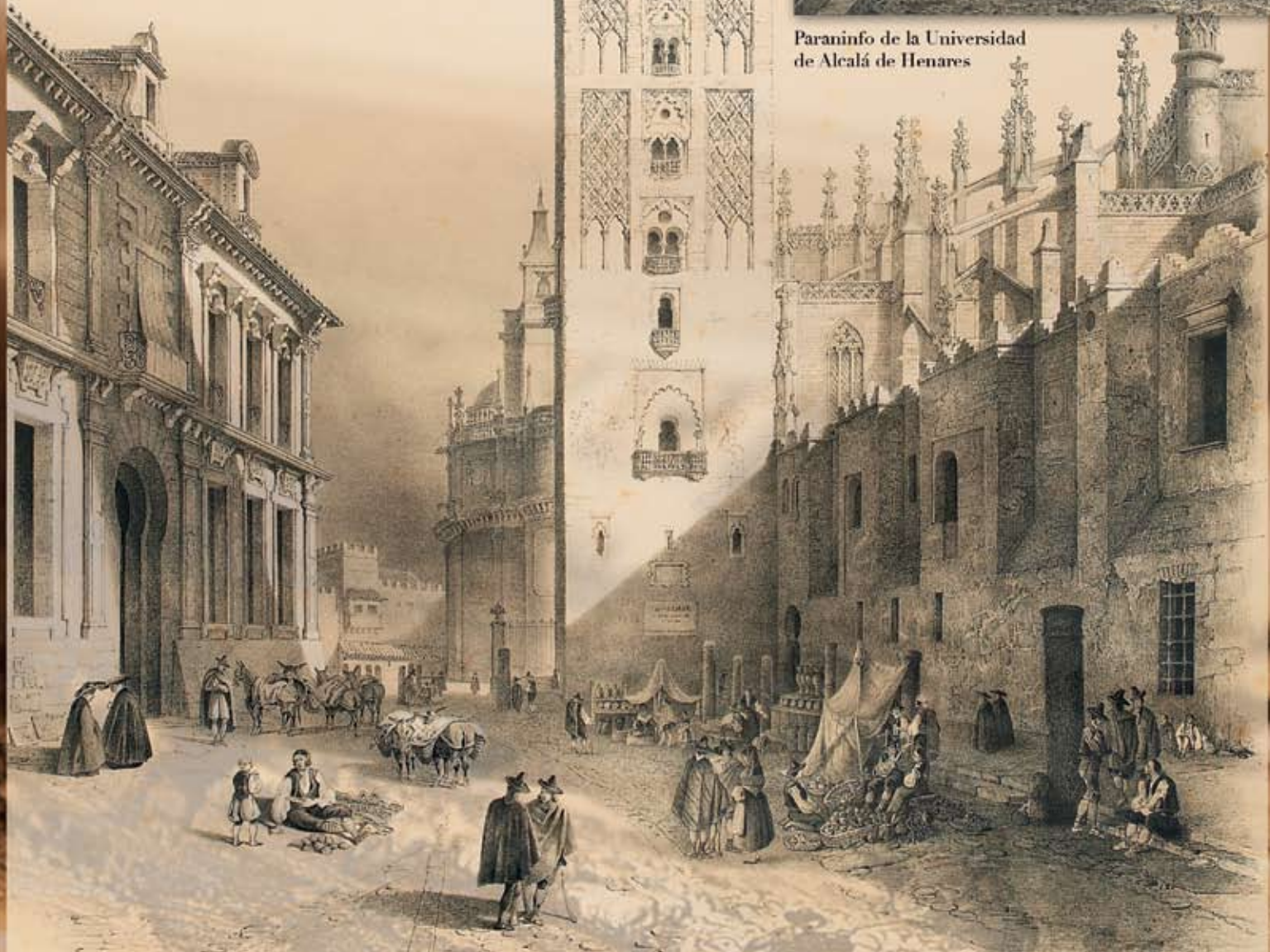
La Giralda de Sevilla