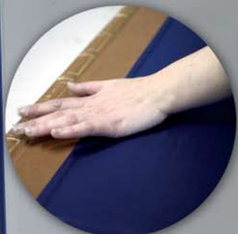
Tapas y trasera en seda natural azul